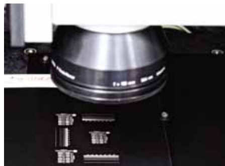
▲ Abb. 4: Testmuster zur Ermittlung von Vibrationen.

Konzept mit simultaner Ansteuerung war das Lasergravieren eines großflächigen Rautenmusters. Im Vergleich zur herkömmlichen kachelartigen Bearbeitung konnte mit der simultanen Bearbeitung die Prozesszeit um 24 Prozent gesenkt werden – auch hier ohne erkennbare Stitching-Fehler. Über Markieranwendungen hinaus wurde auch das Bohren von Löchern – 10.000 Löcher in einem Abstand von nur 1 mm auf einem großen Bearbeitungsfeld von 50 × 200 mm 2 – im Vergleich getestet. Dabei wurde die Genauigkeit der Bearbeitung signifikant erhöht. Grund dafür ist, dass das ausgenutzte Bildfeld kleiner gewählt werden kann als das maximale Bildfeld des Scan-Kopfs und höhere Fehler in der Regel am Bildfeldrand auftreten. Die Statistik zur Abweichung der Bohrlöcher von der Sollposition wird in Abb. 3 wiedergegeben und zeigt eine