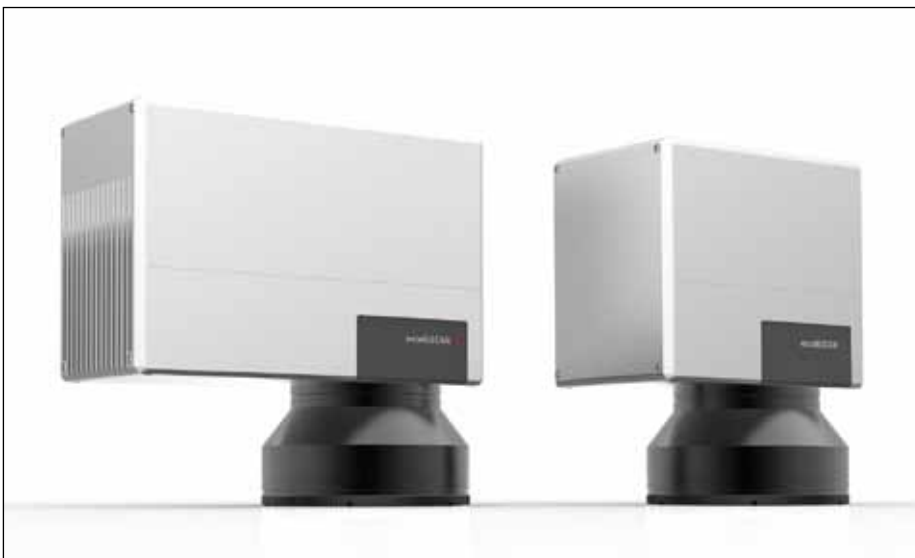
▲ Abb. 1: excelliSCAN Scan-System: Hochdynamisch und präzise im Einsatz, durch die innovative SCANahead Regelung ohne Schleppverzug.

Ein neuartiges Scan-Konzept – bestehend aus einem 2D-Scan-System, einer innovativen Ansteuerungssoftware und zwei Servo-Achsen – eröffnet deutliche Prozess- und Bearbeitungsvorteile. Das erheblich vergrößerte Bildfeld erlaubt nicht nur großflächige Markierungen, sondern ist auch zum Schneiden von Glas und dem Bohren großer Leiterplatten in der Elektronikfertigung sowie für die Mikrobearbeitung hervorragend geeignet.