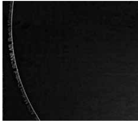
▲ Abb. 2: Bearbeitungsergebnis große Kreisform mit umlaufendem Text.