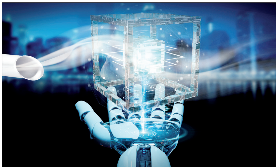
▲ Die Absaug- und Filtertechnik in der additiven Fertigung stellt eine besondere Herausforderung dar.

In diesen ULT Gasfluss Systemen kommen heute vor allem speziell entwickelte Patronenfilter zum Einsatz. In programmierbaren Selbstreinigungszyklen und gestützt durch Sensorik, werden die am Filter angelagerten Partikel mithilfe eines Druck-Impulses abgesprengt und fallen nach unten. Damit ist der Filter wieder gereinigt und kann seine Arbeit weiter aufnehmen. Das gewährleistet unter anderem lange Baujobs und Filterstandzei-