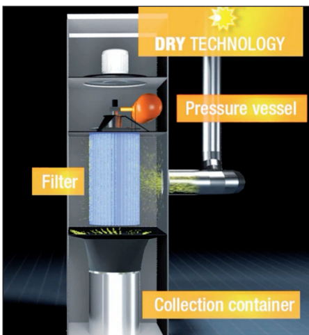
▲ Funktionsprinzip der selbstreinigenden Patronenfilter.